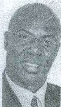
KAULI YA WALIBORA

"Ilikuwa furaha iliyoje kutangamana na nguli huyu wa fani ya ubunifu na taaluma ambaye aliegemea sana katika falsafa"